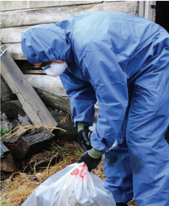
هنگام دست زدن به مواد حاوی آزبست همواره لباس محافظ به تن داشته باشید و بلافاصله آن را دور بیندازید.

PPE به صورت بازاری در تأمین کنندگان ساخت و ساز، خرده فروشان تجهیزات ایمنی و برخی از فروشگاه های زنجیره ای ابزار آلات موجود می باشد.